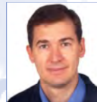
Emmanuel Niclaus Gan Eurocourtage